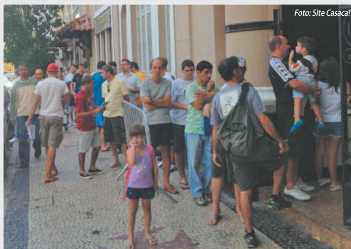
Durante a campanha milhares de novos associados fizeram filas no portão do clube

Você quer se tornar sócio? Impossível. Na última sexta-feira, um leitor do CASACA! esteve em São Januário para tentar se associar ao clube. Encontrou as portas do programa de sócios trancadas. Seria de bom tom que a "direção" esclarecesse às pessoas se a associação ao clube não é possível, ao menos no momento, a fim de que elas não compareçam ao clube em vão. Há informações de que a associação pelo site do programa também está bloqueada. CASACA!